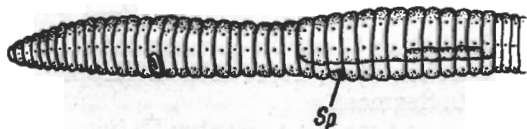
Abb. 2. Dendrobaena osellai sp. nov. Seitenansicht. Sp=Spermatophoren

Kopf epilobisch 1/2 offen. Erster Rückenporus auf Intersegmentalfurche 5/6 . Borsten ungepaart. Borstendistanz aa doppelt so groß wie ab > bc > cd ; dd größer als aa . Männliche Poren auf dem 15. Segment, deutlich zu erkennen,