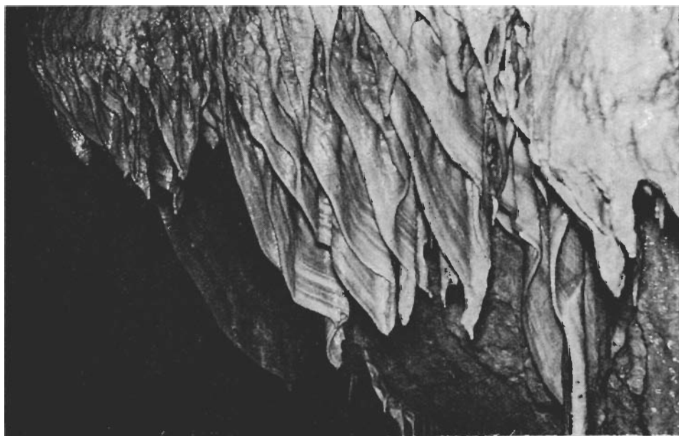
Fig. 2. L'entrée de la grotte Meteor dans l'année de la découverte (Photo: DÉNES). — Fig. 3. Drapeaux de stalactites dans la Galerie des titans (Photo: DÉNES).