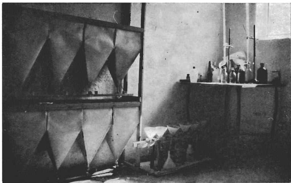
Fig. 4. Détail de stalactites courbées dans la grotte Meteor. — Fig. 5. Appareil „Berlese“ dans la maison spéléologique de Bódvaszilas