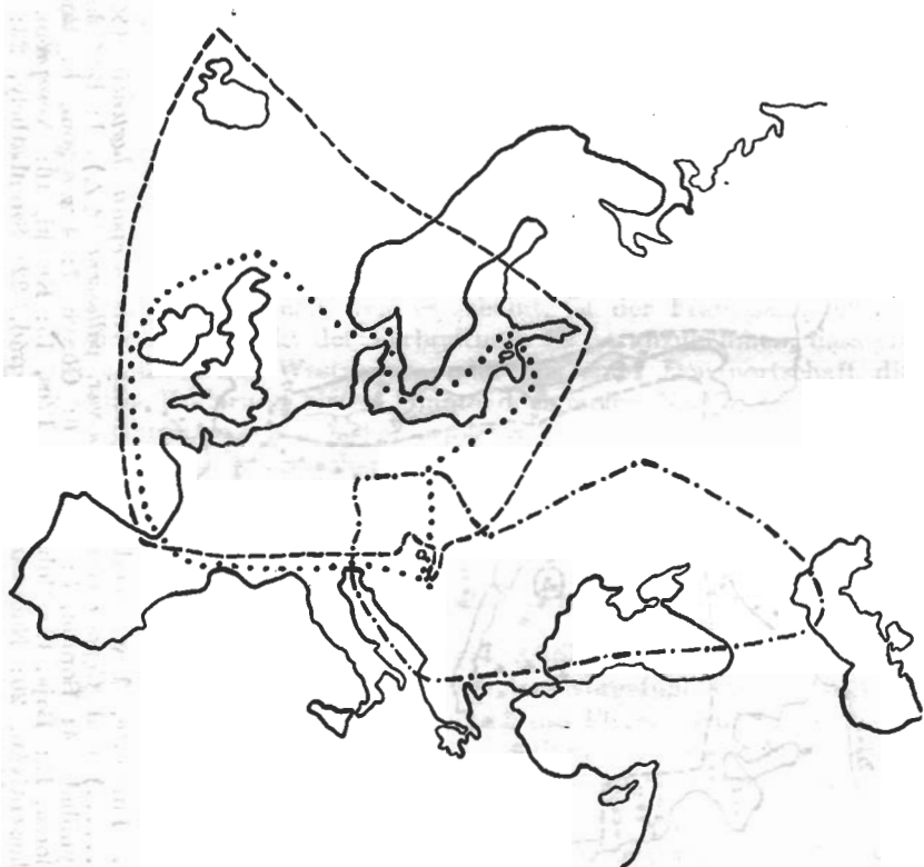
Abb. 2. Europäische Verbreitungsarea der Arten Cepaea hortensis (---), C. nemoralis (.....) und C. vindobonensis (-.-.-). (Das Exklave: ( ) bedeutet die Stadt Veszprém.)

E. Csiki schreibt in Fauna Regni Hungariae (3, p. 23) von dieser Art: „in toto regno frequens“, d. h. häufig im ganzen Lande. In der Tat, es scheint unnötig und auch fast unmöglich alle Fundorte aufzuzählen, denn diese Schnecke lebt überall, wo sie die Lebensbedingungen auffin-